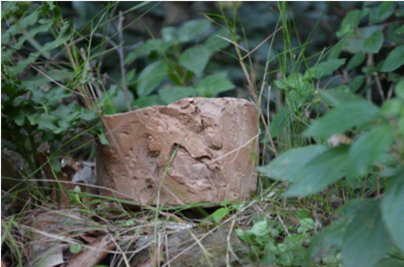
Escudella , bol que va fer servir Sant Ignasi per a menjar durant la seva estada a Manresa. Actualment es conserva al Museu de La Cova.